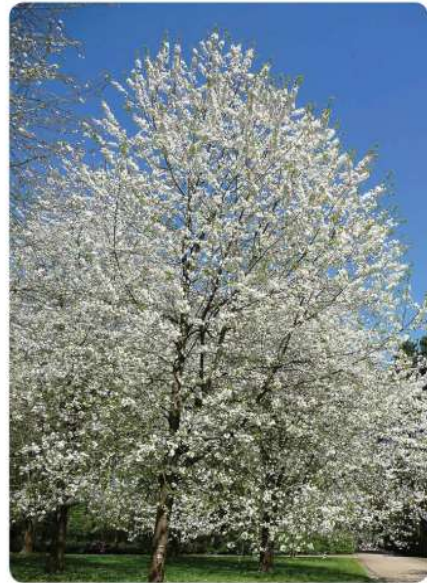
Prunus avium 'Plena'