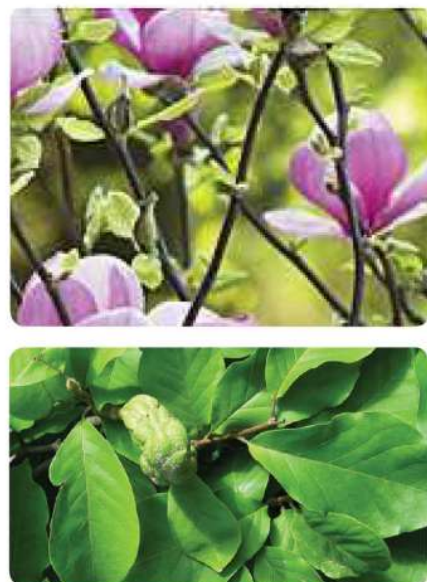
Magnolia x soulangeana