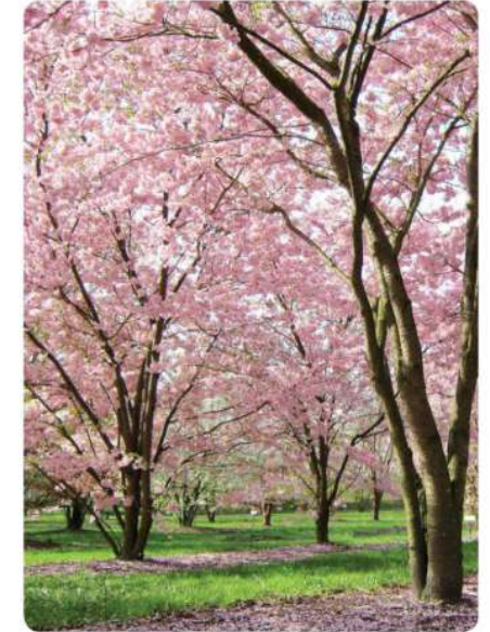
Cerisier à fleurs