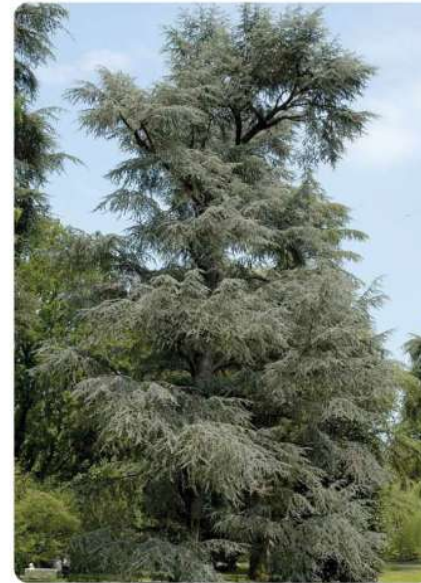
Cedrus libani 'Glauca'